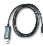
Ve.Direct naar USB interface